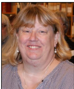
af Gitte Bergendorff Høstbo, egne foto taget på Ellis Island 2008.