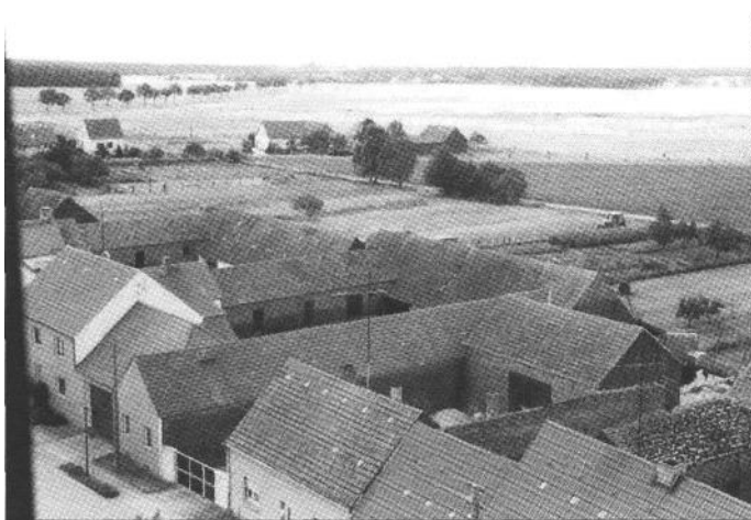
Gården i Ruhlsdorf ses her, stuehuset er det toetagers hus der ses til venstre i billedet