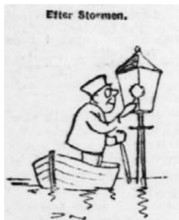
Der var ikke billeder i avisen den gang, men tegnerne havde travlt.

Efterhånden, som man får overblik over stormskaderne på Bogenseegnen, ses det, at denne egn er langt den hårdest ramte på Fyn og måske så svært medtaget som ingen anden egn i landet. Ulykken betegnes som den største der i mands minde har ramt Bogense By. Hvor mange mennesker, der lider skade ved den, kan endnu ikke opgives, men omkring 100 ejendomme anslås til at være delvis ødelagte og i hvert fald står forringede i værdi. Hele den lange kyst fra Jersore til Varbjerg er stærkt medtaget, og der vil gå lange tider, inden følgerne af den store stormflod er overvundet. Det var