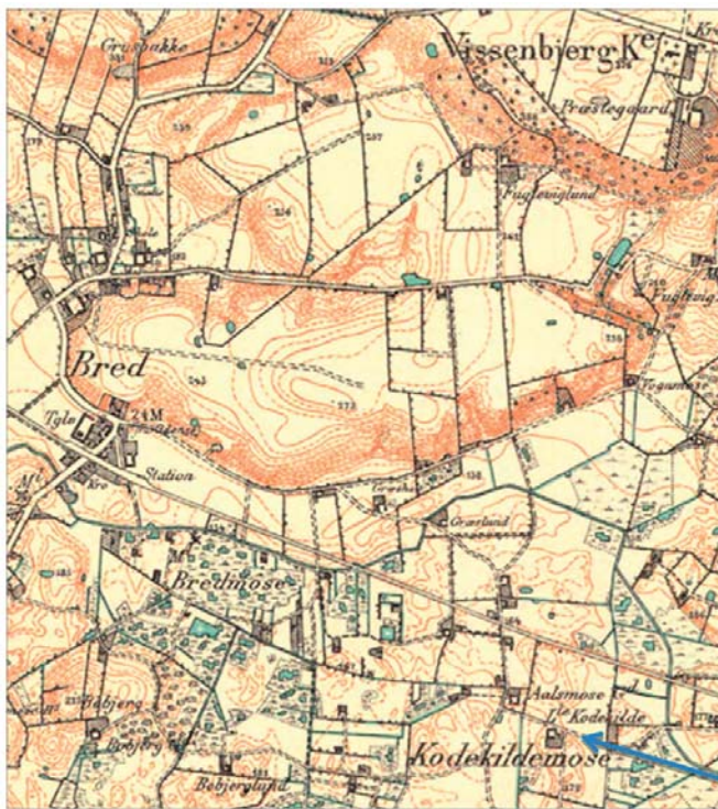
Udsnit af: Målebordsblad I 2 Vissenbjerg (sidst rettet 1890; udg. 1892)

»Assens amt«! Bred ligger i Vissenbjerg sogn. »Lille Kaadekilde /Kodekilde«, hvor hun er født, i Orte sogn. Til forvirring for os, var hun – ligesom 7 andre fra Orte sogn – medio 1882, døbt i Skydebjerg kirke (i nabosognet Skydebjerg)