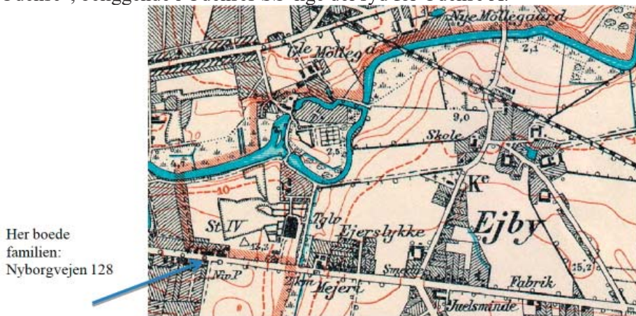
Udsnit af: Målebordsblad 3616 Odense (sidst rettet 1916; udg. 1918)

Vi vælger det pågældende kortblad og finder det omtalte fødested: ”Ejby ved Odense”, beliggende i Odenses SØ-lige del syd for Odense Å.