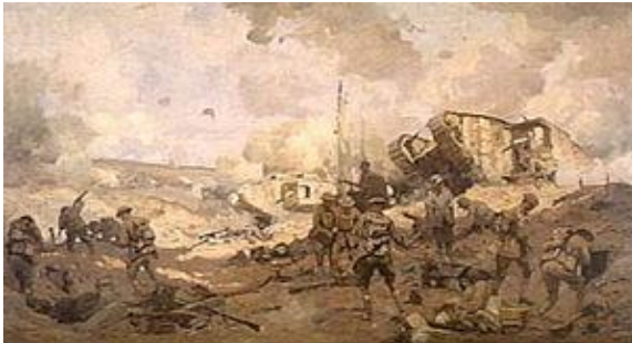
Gennembrydning af Hindenburg-linien 29. sep. - 10. okt. 1918