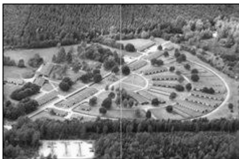
Frøslevlejren i dag.

Desuden var aftalen, at allerede deporterede fanger kunne bringes tilbage til Frøslevlejren. Denne aftale blev dog ikke overholdt. Nogle fanger, omkring 1.600, blev fra Frøslev overført til kz-lejre i Neuengamme (ved