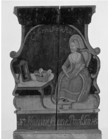
Københavnsk jordemoder-gadeskilt fra 1785 (Nat.mus.)

70 % af ansøgerne til skolen i København, kom fra de store byer. Der var en vis prestige i at være jordemoder. Nogle større godser var dog interesserede i at have tilknyttet en jordemoder.