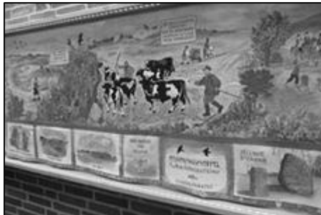
Hærvejstæppe, Søndermarkskirken, Viborg

Afstanden mellem kroerne svarede til en dagsrejse, som på Erik Klippings tid (midten af 1200-årene) kunne være op til 4 mil. 2-3 mil var en mere normal dagsrejse, det svarer til 20-25 km., en almindelig dagmarch til fods.