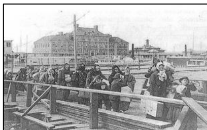
Ankomst til Ellis Island

De fleste udvandrere fandt vel et godt liv i det nye. Men der er også eksempler på det modsatte. Der er skrevet en bog ” Det glemte eksperiment” der fortæller om 250 danskere der, så sent som i 1938, rejste til Venezuela. De skulle opbygge en landbrugskoloni, som senere skulle udvides med flere tilflyttere fra Danmark. Projektet blev betalt af den venezuelanske stat, og den danske stat ansporede også til