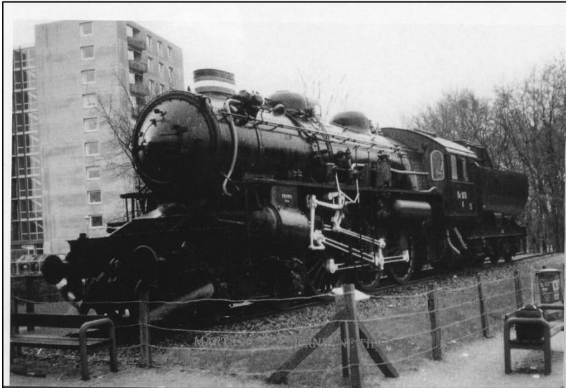
E 978 passede fint ind i billedet med moderne byggeri i baggrunden i Fredericia.

E 978 er stadig i museets varetægt i Randers. Der er endnu ikke taget stilling til maskinens videre skæbne.