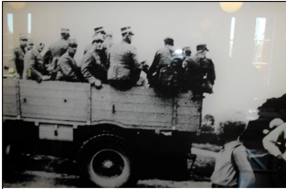
Gendarmerne køres til internering.

muligvis frygtet, at de menige gendarmere kunne være lige så fædrelandstro og halsstarrige som deres chef oberst Svend Paludan-Müller, som var faldet alene mand i kamp mod tyskerne og Gestapo i sit hjem i Graasten den 26. maj tidligere på året. – Men så: Pludselig om morgenen den 5. oktober 1944 rygtedes det: "Nu kører de med gendarmerne!" 141 af disse sagesløse tjenestemænd blev deporteret til kz-lejren Neuengamme og mange derfra videre til forskellige arbejdslejre.