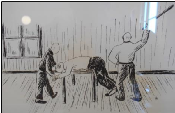
Afstraffelse med stokkeslag fra Frøslevlejrens udstilling

dansk soldaterkammerat. Datteren, som var gravid, måtte bare se på, at tyskerne førte hendes mand og hendes far væk.