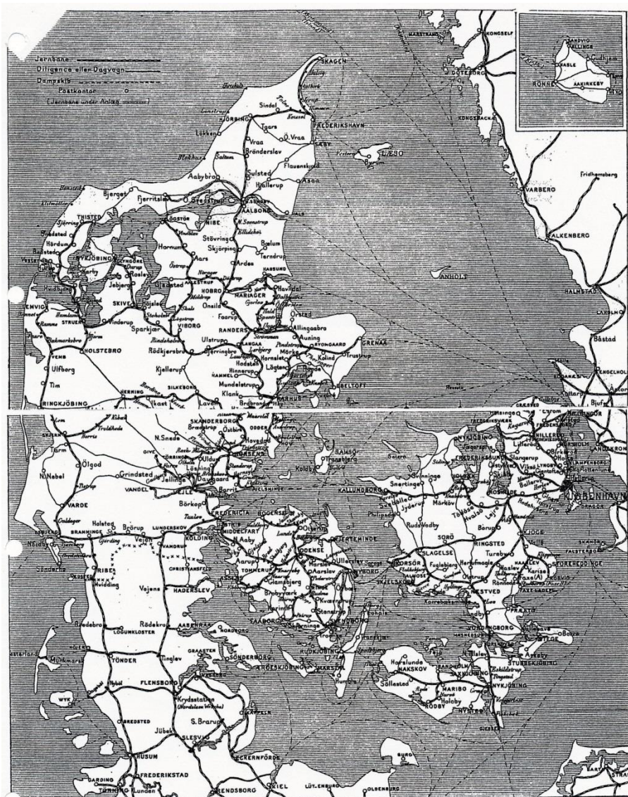
Offentlige rejseruter ca. 1895

Kortet over »Offentlige rejseruter ca. 1895« kan give ideer til hvor pas har skullet forevises.