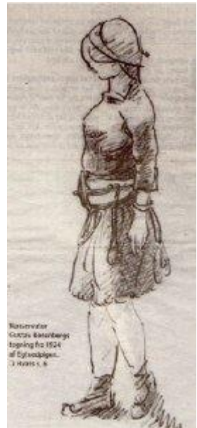
Museet Gustav Boserup Egtved fra 1924 af Egtvedpigen. 1. April 1924

Den 8. september kunne museet meddele, at fundet ville være tilgængeligt for publikum, og det blev et tilløbsstykke. På én dag havde der således været 1600 besøgende. Man skulle næsten tro, at det havde været en hval, som var udstillet.