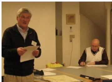
Formanden og dirigenten