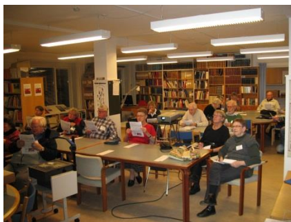
Udsnit af den ivrigt studerende forsamling