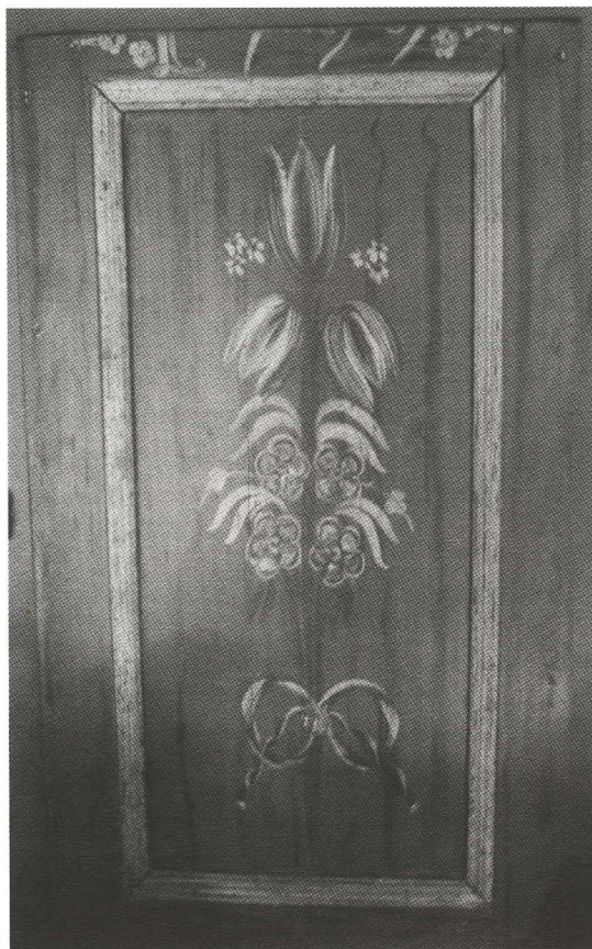
Blomstermalet panelstykke, dateret 1799

*(- dog: en søn blev møller; blandt børnebørnene var en velhavende købmand og en kendt vinhandler og et oldebarn blev rigsdagsmand).