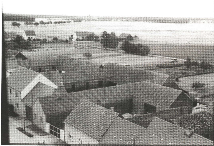
Gården i Rühlsdorf ses her, stuehuset er det toetagers hus der ses til venstre i billedet