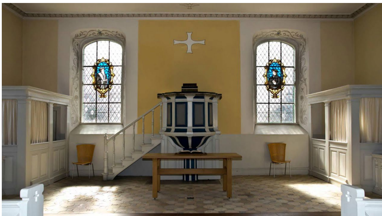
Reformert Kirke i Fredericia.

Den reformerte Kirke bruger heller ikke afbildninger af religiøse symboler, så man finder ingen religiøse billeder, altre, altertavler eller krucifiks i en reformert kirke. Biblens ord betragtes som det vigtigste, så prædikestol og nadverbord står altid centralt placeret i kirken. Præsten vender heller aldrig ryggen til menigheden under gudstjenesten, men udgør en del af menigheden.