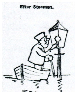
Der var ikke billeder i avisen den gang, men tegnerne havde travlt.

Efterhånden, som man får overblik over stormskaderne på Bogenseegnen, ses det, at denne egn er langt den hardest ramte på Fyn og måske så svært medtaget som ingen anden egn i landet. Ulykken betegnes som den største der i mands minde har ramt Bogense By. Hvor mange mennesker, der lider skade ved den, kan endnu ikke opgives, men omkring 100 ejendomme anslås til at være delvis ødelagte og i hvert fald står forringede i værdi. Hele den lange kyst fra Jersore til Varbjerg er stærkt medtaget, og der vil gå lange tider, inden følgerne af den store stormflod er overvundet. Det var