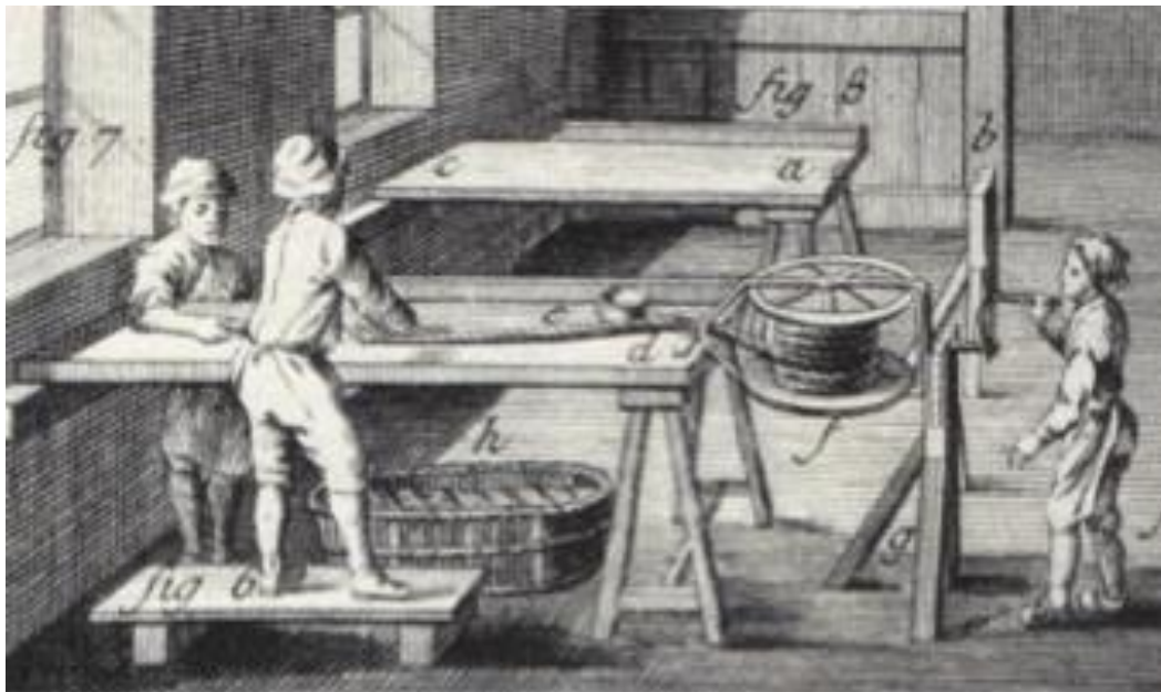
Et tobaksspinderi

Nu var så lejligheden og behovet kommet for at sætte sig ind i, hvad det drejede sig om. Opslag i en af de gamle, uforlignelig gode, sribede håndbøger fra Politikens Forlag »Gamle Danske Håndværk« (1971), hjalp på forståelsen: Fremstillingen af spunden tobak ("curly cut") foregik/foregår således: