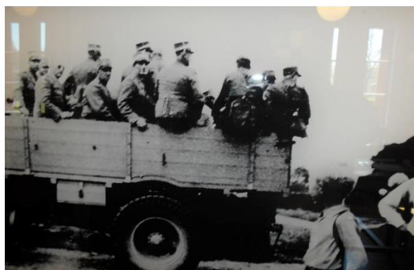
Gendarmene køres til internering.

FRØSLEV-lejren ved Padborg på den danske side af grænsen, blev bygget i 1944 som en tysk interneringslejr, men tyskerne accepterede, at det danske fængselsvæsen stod for forplejningen af fangerne. Hensigten fra dansk side var et forsøg på at undgå deportationer af danskere til koncentrationslejre i Tyskland. "Alligevel blev cirka 1.600 Frøslevfanger, stik imod alle aftaler, sendt videre til tyske kz-lejres rædsler", oplyser Nationalmuseets folder om Frøslevlejren.