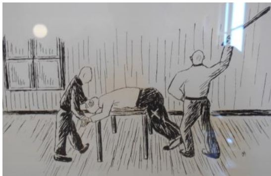
Afstraffelse med stokkeslag fra Frøslevlejrens udstilling