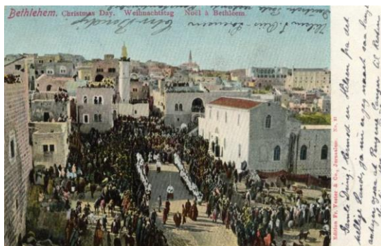
Jul i Betlehem

Svendene fra Skandinavien fulgte som regel bestemte rejseruter gennem egne, hvor der jævnligt var arbejde at få: Ned over grænsen til Hamborg og videre over Hannover til Köln og ned langs Rhinen, ind i Schweiz til Basel og Zürich og derfra til München og Wien inden turen igen gik nordover over Prag, Dresden og Berlin og så hjem igen. Så skulle der gerne være gået mindst "3 år og 1 dag". Naturligvis kunne den enkelte vandrende svends rejserute alt efter fag, interesser og arbejdsmuligheder, afvige betydeligt fra den her angivne.